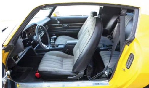
Intakt LT-inredning så när som på tillbehörsratten från 70-talet och glimten av en B&M shifter växelspak som avslöjar att något inte är som det var när bilen lämnade fabriken för 47 år sedan.

den smidda veven som klämdes fast med H profil, vevstakar samt varvades med en ilsken Isky-kamaxel med 0.485-tums lyft intryckt ovanpå.